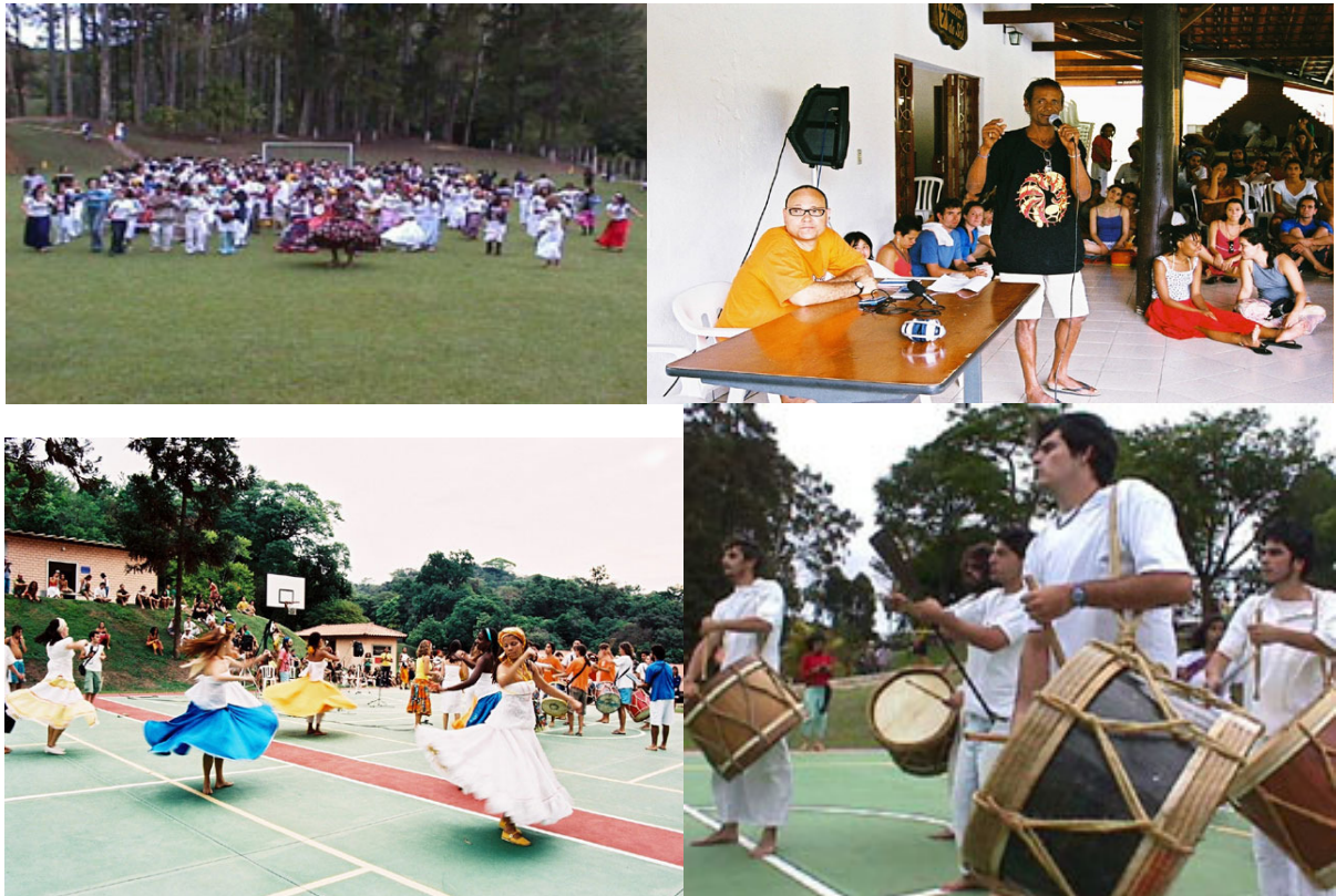
Fig. 2, 3, 4 e 5. Imagens do II encontro nacional de pessoas que trabalham com a música e a dança do maracatu de baque virado em 2003 no Estado de São Paulo.

A natureza deste visa ainda abordar dentro das nações de maracatu de baque virado do Recife, os fatores reagentes do religioso, da tradição e da identidade, percebendo o que as nações consideram ou mantêm como tradicional. O maracatu do tipo nação figura com destaque na cena cultural, local, regional, nacional e até internacional. Seus mestres são cobiçados por oficinas até no exterior como no caso dos mestres das nações Estrela Brilhante do Recife, Porto Rico do Oriente, Estrela Brilhante de Igarassu, Cambinda Estrela, Encanto da Alegria, entre outras nações. E como eventos de alcance nacional como os Encontros nacionais de pessoas que trabalham com a música e dança do maracatu de baque virado realizados em São Paulo.