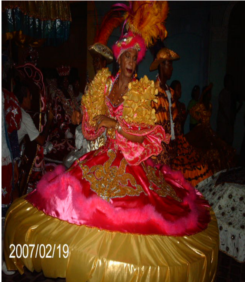
Fig. 7. Baiana rica da nação de maracatu Estrela Brilhante do Recife. Noite dos tambores silenciosos em 2007