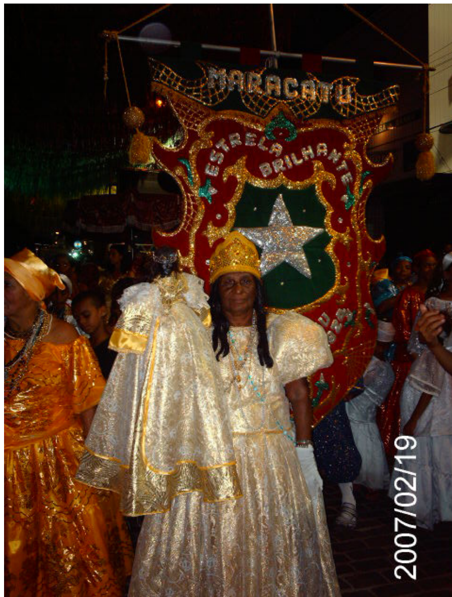
Fig. 6. Dama do paço do maracatu Estrela Brilhante de Igarassu. Noite dos tambores silenciosos 2007.

Então, desvendar este fenômeno em torno dos maracatus nação do Recife é simplesmente extraordinário. Sendo assim, depoimentos dos brincantes e obras literárias que versem sobre o maracatu será a argamassa do corpo deste trabalho. Como principal objetivo, queremos compreender a relação com a religião dos Orixás, dentro de suas comunidades e terreiros, identificando a relação entre comunidade e sua relação com outros maracatus e não menos importante o diálogo com a classe média tentando abarcar a inserção destes dentro dos maracatus Nação, visto que são de realidades bastante antagônicas. Hoje temos variados grupos percussivos espalhados pelo Brasil e pelo mundo, no Recife existe um movimento